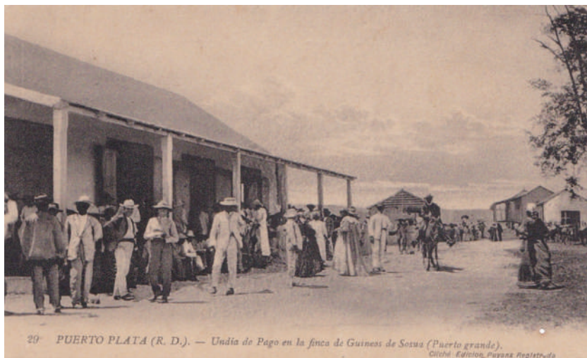
Un día de pago en la finca de Guineo de Sosua, Puerto Plata.

funcionaban más de trece fincas de gran tamaño y muy productivas, además de muchas otras de pequeñas dimensiones, pero igualmente productivas; la más importante de todas era la plantación de guineos de la United Fruit Co. Dominican Division , que tenía acueducto propio, ferrocarril y sistema telefónico. 87