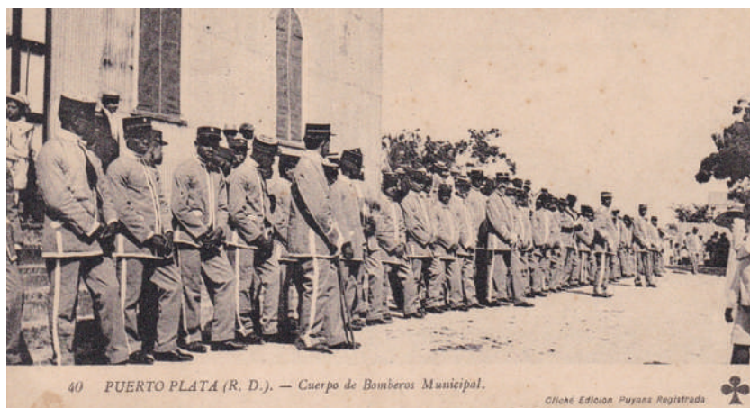
Cuerpo de Bomberos Municipal.