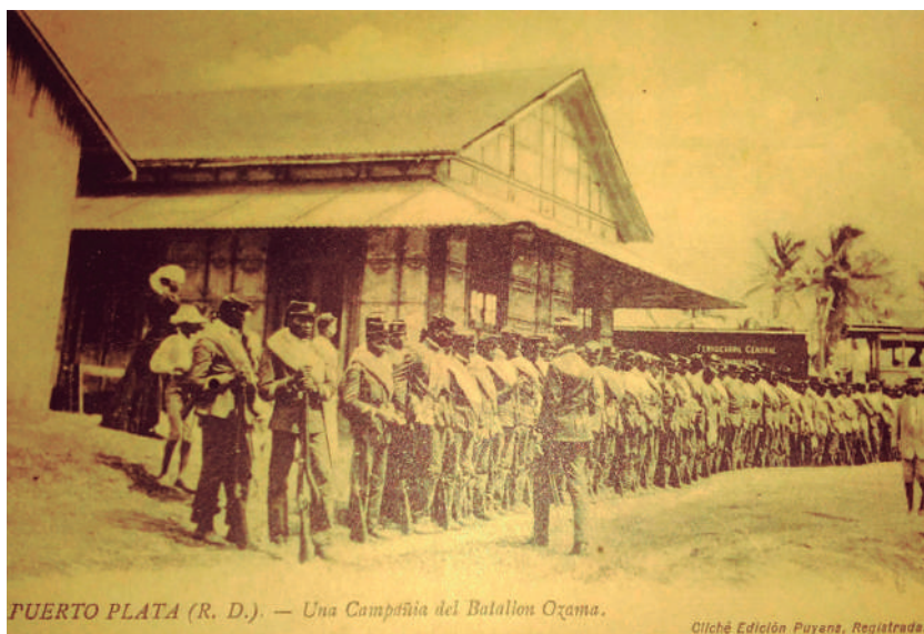
FUERTO PLATA (R. D.). — Una Campaña del Batallón Ozama.