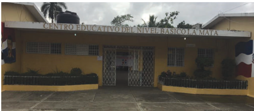
Imagen de la Escuela Primaria Principal de La Mata

En lo que respecta a las actividades formativas y extracurriculares, en este centro se realizan actividades de las diferentes fechas conmemorativas del año extendiendo la misma hacia la comunidad, con la cual se mantiene muy buenas relaciones con los comunitarios, entre estas se pueden mencionar, las actividades culturales, religiosas, charlas en beneficio de la comunidad, competencia deportiva, carnaval, coro, poesía coreada, club de teatro, club de lectura, club de matemática, entre otras. (Proyecto de Gestión del Centro, 2018).